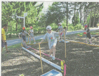
Beim Aktionstag am Donnerstag auf dem Gelände des INS konnten sich die Schüler unter anderem an Slacklining versuchen.